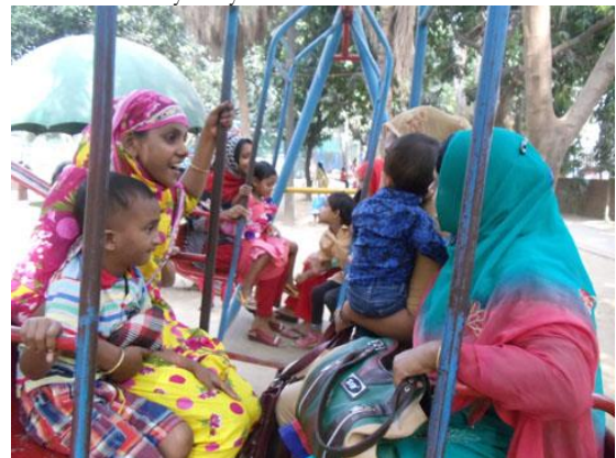
Moeders op de schommel tijdens een uitje.

Als eerste trainingsproject gaan ze papieren boodschappenzakken vervaardigen voor winkels in de buurt - in Bangladesh zijn plastic boodschappentassen al meer dan tien jaar verboden, omdat ze onder meer de regenafvoer in de straten blokkeerden tijdens de zware Bengaalse moessons. Bij de beroepstraining zal veel aandacht worden besteed aan arbeidshouding, sociale interactie en hygiëne op de werkplaats. Niketan zal tevens binnen het team iemand gaan opleiden die met de methodiek 'My way to Work' leert werken.