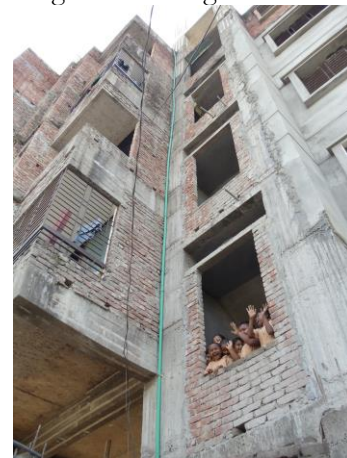
Nog maar slechts een gedeelte van het gebouw is voltooid.

Sanjeevani is verhuisd. Het oude gebouw was veel te klein geworden – er was veel te weinig ruimte voor de klasseactiviteiten in ruimtes die eigenlijk bedoeld waren voor woonhuis/appartement. Niketan/DRRA zijn direkt voortvarend te werk gegaan en hebben een nieuw onderkomen gevonden in dezelfde buurt. Geen sinecure, want Dhaka is een van de snelst groeiende steden ter wereld en de huurprijzen zijn er hoog, zelfs in de sloppenwijken. Het nieuwe onderkomen is een verbetering, maar qua ruimte nog verre van ideaal en dus zal er in het komende jaar verder worden gezocht naar geschiktere behuizing.